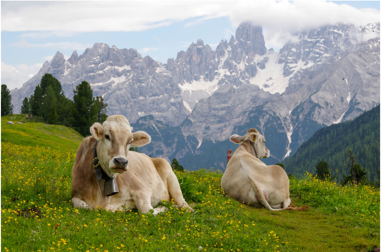
(Kühe auf den Wiesen der Alpenberge)